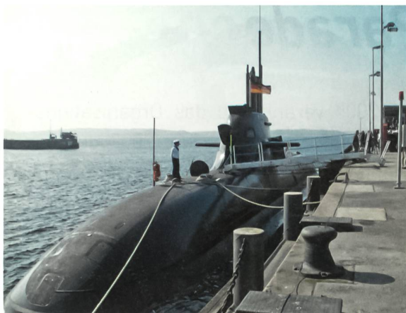
Der Kommandant von «U 32», Kapitänleutnant Tastl, überwacht nach einer Tauchfahrt das Anlegemanöver in Eckernförde.

eigene kleine Kammer, die Kombüse ist gerade mal etwa 2 m 2 gross, und vor Einsatzfahrten hängt überall im Boot an den Decken Proviant, gut verstaut in Netzen.