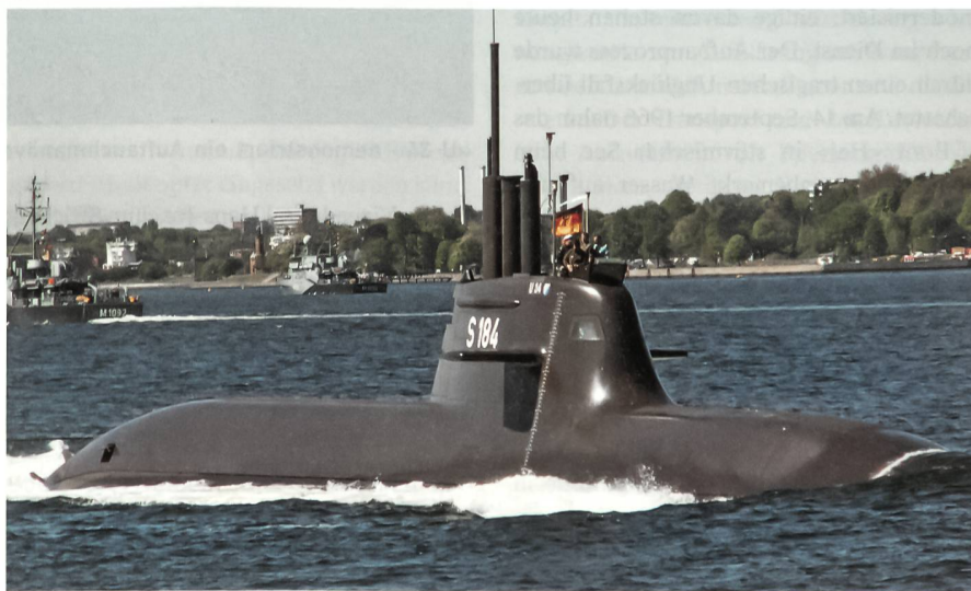
Die «U 34» (S 184) auf der Fahrt in der Kieler Förde.

Erstmals erhielt der Unterseeboot-Krieg eine nachhaltige Bedeutung. Im Mai 1915 versenkte die «U 20» den britischen Passagierdampfer «Lusitania», wobei gegen 1200 Menschen, darunter 120 US-Staatsbürger, ums Leben kamen. Mit diesem schrecklichen Ereignis wurde der Kriegseintritt der USA beschleunigt. Nach der Kapitulation des Deutschen Reiches 1918 hatten die 374 ein-