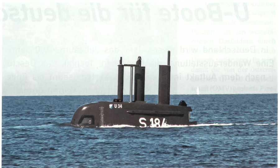
«U 34» demonstriert ein Auftauchmanöver in der Ostsee.

Im Beisein von Staatssekretär Christian Schmidt und des Kommandeurs der