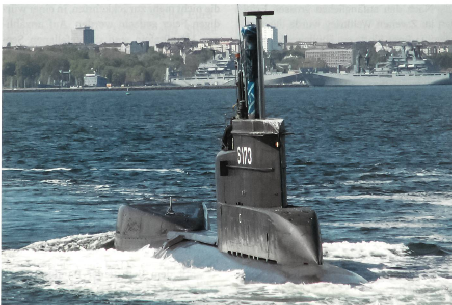
Zum Gedenken erweisen vier U-Boote der deutschen und norwegischen Marine vor dem Denkmal in Möltenort in der Kieler Förde den 35 000 gefallenen U-Boot-Fahrern die Ehre, hier das U-Boot «U 24» (S 173), ein Boot der Klasse 206 A.

Der Innenraum der neuen U-Boote ist wesentlich freundlicher und auch etwas geräumiger als jener der Klasse 206 A. Dank umfassender Automatisierung zählt die Besatzung bloss 28 Offiziere und Unteroffiziere. Diese dürfen über etwas mehr Komfort verfügen, aber eng und spartanisch ist es allemal. Nur der Kommandant hat eine