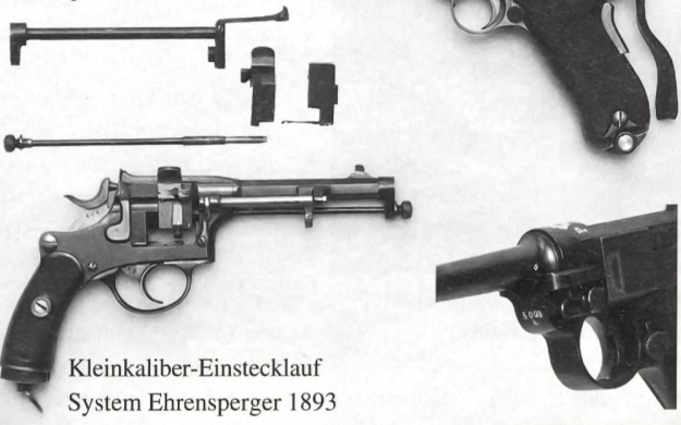
Kleinkaliber-Einstecklauf System Ehrensperger 1893

Reichbebildeter Katalog für Sfr. 20.- erhältlich bei: