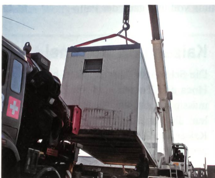
Kran im Kosovo.