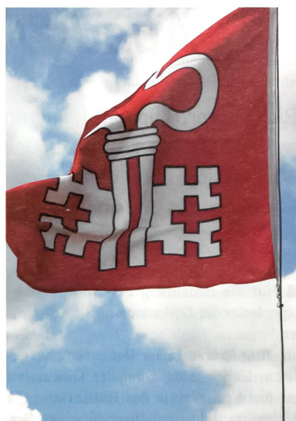
Die Nidwaldner Fahne repräsentiert Stans, den Standort von SWISSINT.