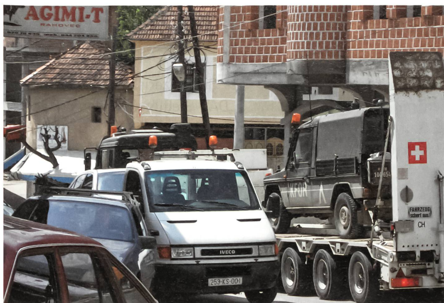
Ein Schweizer Sattelschlepper durchquert mit aufgeladenem Puch die Ortschaft Orhovac im Schwergewichtsabschnitt des österreichisch-schweizerischen Bataillons.