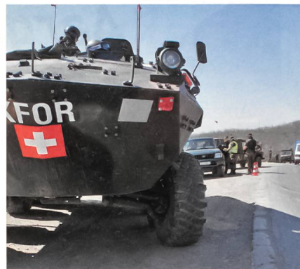
Schweizer Präsenz unten am Pass.