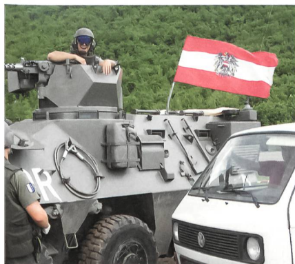
Strassensperre oben auf dem Pass.