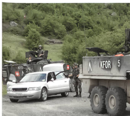
Ein Verdächtiger wird angehalten.