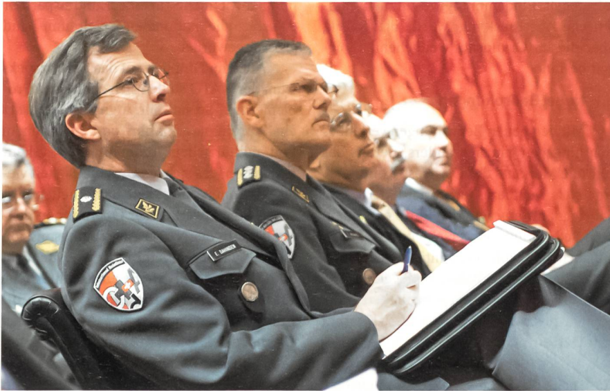
Akteure der schweizerischen PfP-Beteiligung.

Tatsache, dass der nachhaltige Erfolg der NATO in bestimmten Krisenregionen – allen voran im vom Drogenanbau abhängigen Afghanistan – letztlich von Faktoren und Akteuren abhängt, auf die das Bündnis wenig oder keinen Einfluss hat. Da jedoch weder die Europäische Union noch die Vereinten Nationen gegenwärtig den Eindruck erwecken, Afghanistan gehöre zu ihren obersten Prioritäten, trägt die NATO eine überproportionale Bürde.