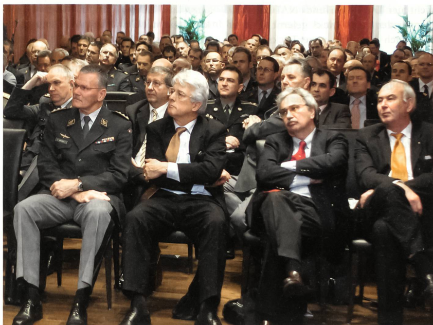
Das Interesse am Anlass war ausgeprägt.

Die laufenden Einsätze beanspruchen einen steigenden Anteil der ohnehin knappen Verteidigungsbudgets, was sich negativ auf die längerfristige Modernisierung der Streitkräfte auswirkt. Und vor allem: in den Vorbehalten mancher Nationen über die Verwendung der eigenen Streitkräfte in Operationen zeigen sich deutliche Unterschiede in der Risikobereitschaft – ein Faktor, der sich für eine operativ mehr und mehr beanspruchte NATO als schwere Hypothek erweisen könnte. Hinzu kommt die