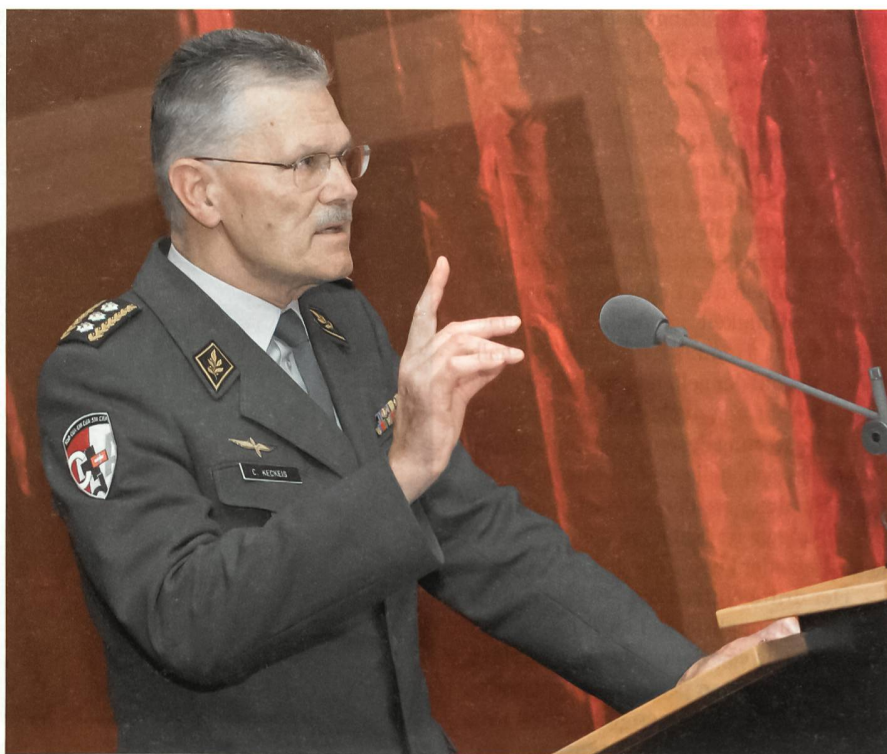
Der Chef der Armee betont die Bedeutung von Standards und Benchmarks.

Im Rahmen ihrer Regionalen Militärischen Kooperation unterstützt die Armee diesen Prozess gerade auch über die PfP-Plattform laufend durch Expertise und materielle Unterstützung sowie finanzielle Beiträge zum Beispiel über den NATO/PfP Trust Fund. So hat sie nachhaltig zum Aufbau eines regionalen Kommunikations-Ausbildungszentrums für den Westbalkan in Skopje beigetragen. Weiter beteiligt sie