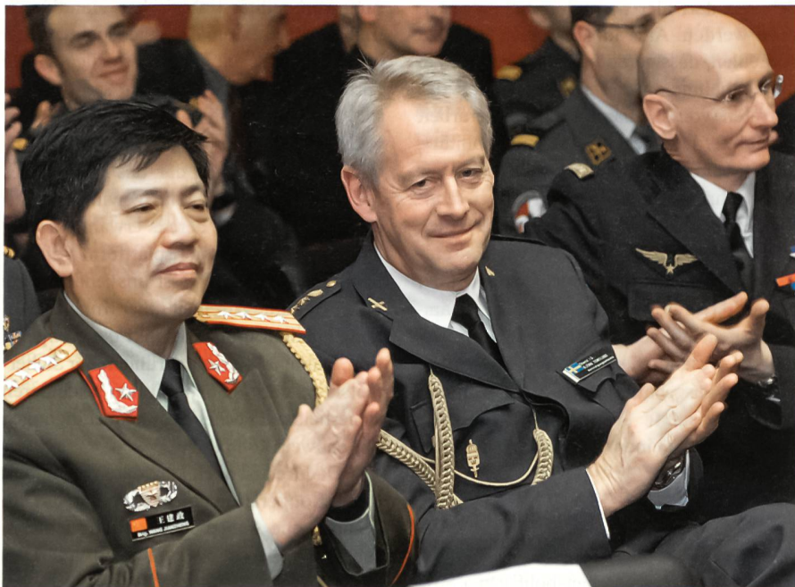
Ausländische Verteidigungsattachés als interessierte Zuhörer.

Als weiteres Mittel zur militärischen Zusammenarbeit hat die Schweiz seit Jah-