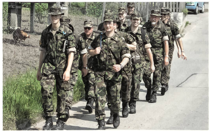
Gut in Form.