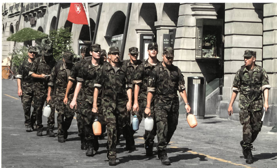
Zügig durch Bern.

Trotzdem, und dies zeigt deutlich das Bedürfnis aus Sicht der Teilnehmer, haben sich knapp 400 Personen, davon rund 150 aus dem Ausland, angemeldet. Als Ziel galt es, sich für den grössten Marschanlass der Welt, den Viertägeler in