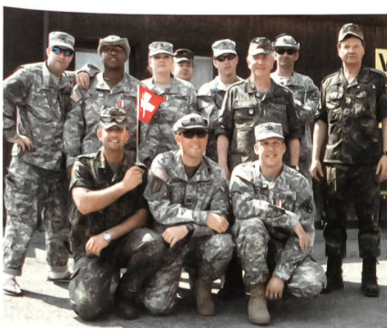
Gäste aus den USA.