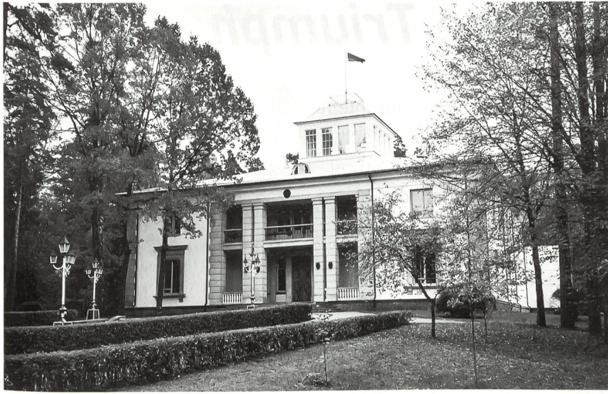
Im Jagdschloss Viskuli nördlich von Minsk traf sich am 8. Dezember 1991 Boris Jelzin mit den Präsidenten der Ukraine und Weissrusslands, um die Sowjetunion aufzulösen.

ter, wie sich dieser Putsch von oben abgespielt hatte.