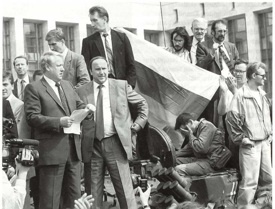
19. August 1991: Auf einem Panzer vor dem Weissen Haus von Moskau ruft Boris Jelzin zum Widerstand gegen die kommunistischen Hardliner auf. Rechts von ihm steht mit offenem Kittel der gefürchtete spätere Haushofmeister des Kremls, Alexander Korschakow.

Auch Fallschirmjäger aus Tula, unter dem Kommando von Oberst Alexander Lebed, waren angekommen. Lebed hat mir später erklärt, dass er an diesem Tag