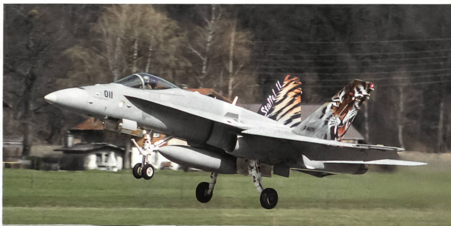
Landung in Meiringen.

Als Gegenleistung müssen natürlich Verbesserungen in der Lärmsituation in Meiringen und Sion erreicht werden. Es liegt auf der Hand, dass dies nur mit einer Reduktion und Verlagerung der Flugbewegungen erreicht werden kann. Eine mögliche Lösung wäre die Entlastung von Meiringen und Sion analog dem Flugbetrieb vor 2005, nämlich Entlastung in den touris-