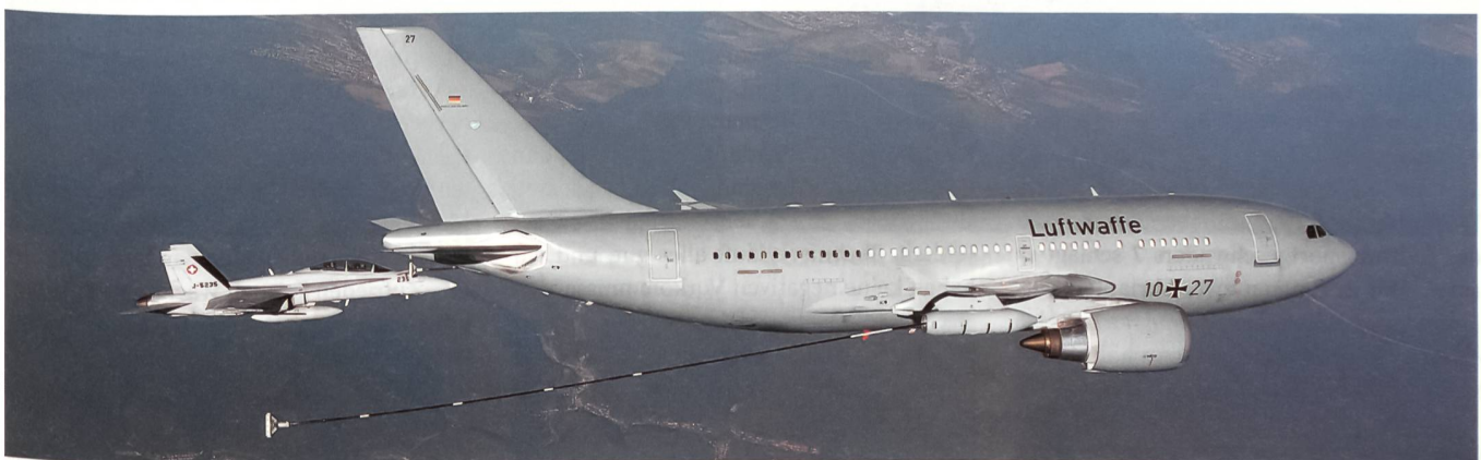
Betankung auf rund 11000 Metern über Deutschland.