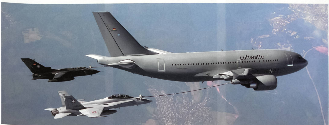
Betanken mit Airbus A-310, F/A-18 und Tornado, hier auf geringerer Höhe.