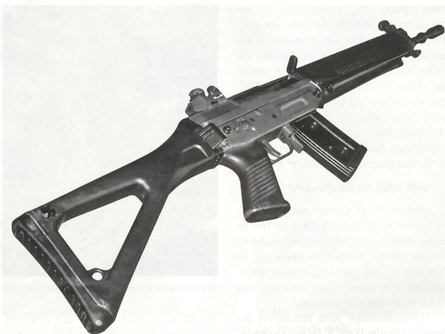
Das Sturmgewehr, die Waffe des Schweizer Soldaten.

Die Beherrschung der persönlichen Waffe wird während der Grundausbildung