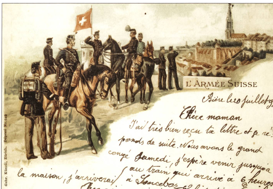
Grüsse aus dem Soldatenleben.

Am Wiener Kongress von 1815 wurde die Schweiz als unabhängiger Staat anerkannt und dazu verpflichtet, die Neutralität nötigenfalls mit Waffengewalt zu verteidigen.