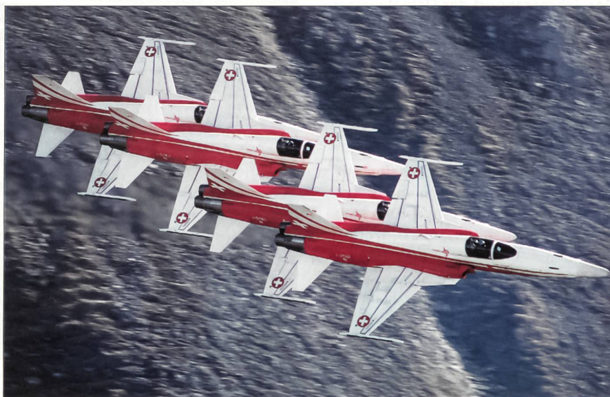
Die Patrouille Suisse soll noch lange auch in den Alpen fliegen können.

Auch Bundesrat Samuel Schmid, der Chef des VBS, wandte sich gegen Webers Vorstoss: «Letztlich geht es darum zu entscheiden, wie weit wir noch eine einsatzfähige Luftwaffe haben wollen. Dass zu unserer Neutralität eine spezielle Befähigung gehört, den