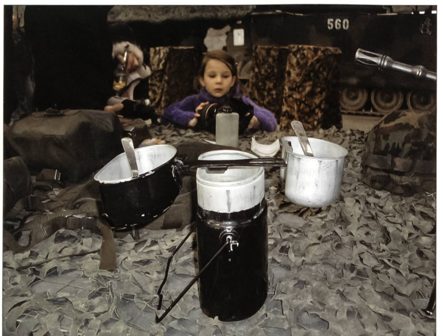
Kind mit Gamellen.

Wm Samuel Kummer (Four Anw) und Wm Christian Frey (Fw Anw) sind seit fünf Wochen im Praktikum. Erst nach Bestehen dieses Praktikums werden sie zum Four und zum Fw befördert und begleiten die Schule in die Verlegung nach Bure, wo sie ihren Grad «abverdienen». Wm Kummer ist am TdA verantwortlich für die Organisation der Verpflegung, das Erstellen und Kontrollieren der Fassstrassen-