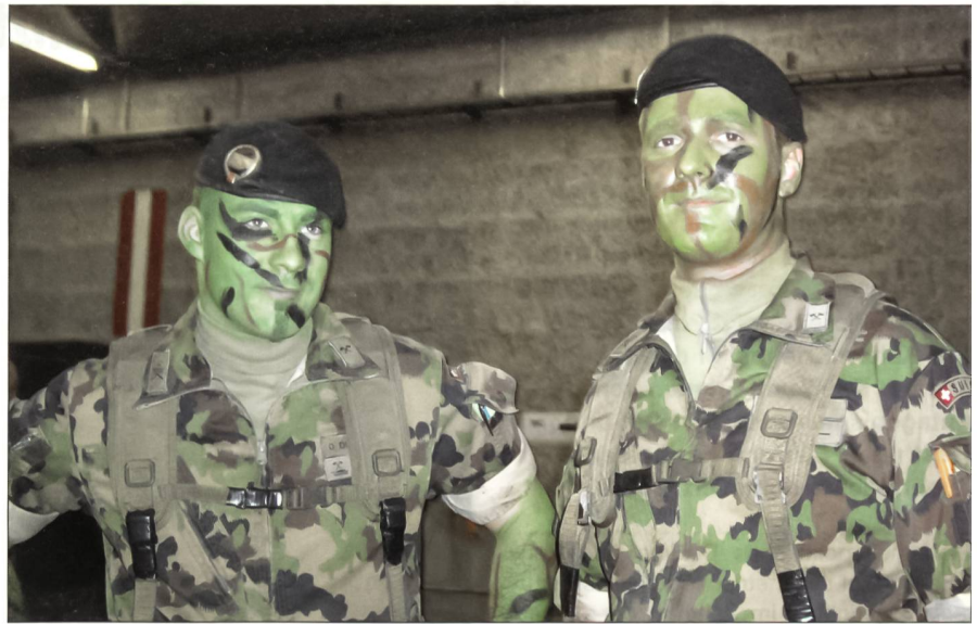
Junge Kämpfer, wie sie typisch sind für die Schweizer Armee.