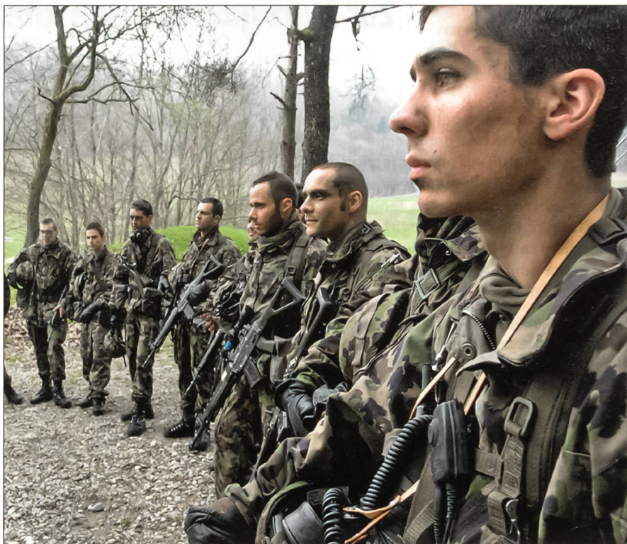
Kampftruppen sollen als Kampftruppen eingesetzt werden.

Eine zusätzliche Vision des SUOV ist das Fördern und Nutzen des Networking seiner Mitglieder. Eine weitere Eigenheit der Schweizer Milizarmee, die mit der Verkürzung der Dienstzeit verloren gehen wird. Das «Schweizer Militär-Netzwerk» ist Garant, dass der Vielvölkerstaat Schweiz bestehen und wachsen kann.