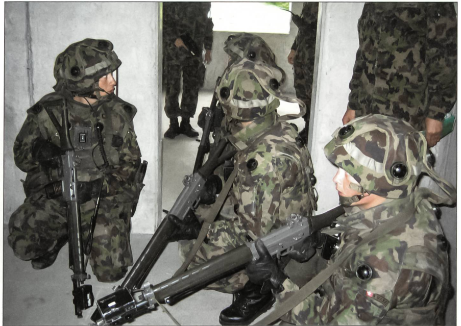
Häuserkampf in Anschwilten.

Jede Neuorganisation bringt Änderungen mit sich, neben den Risiken beinhaltet sie