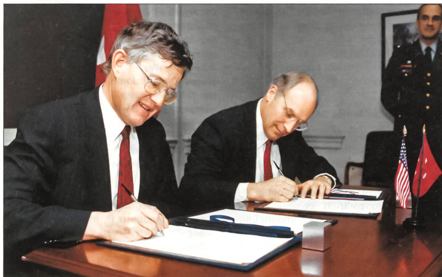
Der politische Vater der Armee reform 95 war Bundesrat Kaspar Villiger. Die Aufnahme zeigt ihn anlässlich eines Besuches im Pentagon im März 1990 bei der Unterschrift eines Memorandum of Understanding zusammen mit dem damaligen Verteidigungsminister und heutigen Vizepräsidenten Dick Cheney.

Die neue Armee sollte dem neuen Umfeld, aber auch dem Empfinden der Schweizer Bevölkerung Rechnung tragen. Vor allem zeigten die Risikoanalysen, die übrigens eine erstaunliche Ähnlichkeit zum heutigen Bedrohungsbild aufweisen, dass der Armeeauftrag erweitert werden musste. So sahen die Aufträge neu eine Dreiteilung vor, nämlich den Hauptauftrag «Kriegsverhinderung und Verteidigung» sowie die Zusatzaufträge «Allgemeine Existenzsiche-