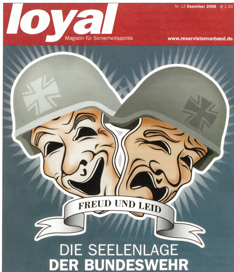
Das Titelblatt der Zeitschrift des deutschen Reservistenverbandes vom Dezember 2006.

Laut Feldmeyer gibt es Bundeswehr-Soldaten, welche die Auslandseinsätze aus Alltagsfrust ablehnen: «Im Kongo-Einsatz war es die Ablehnung der Mission, weil diese keinen erkennbaren praktischen Zweck gehabt hat und deshalb für die Soldaten keinen Sinn machte. Viele Soldaten glaubten nicht daran, dass ihr 800-Mann-Kontingent irgendetwas Vernünftiges bewirken könne. Auch die Unwägbarkeit, auf Kindersoldaten schießen zu müssen, wenn diese das Feuer eröffne-