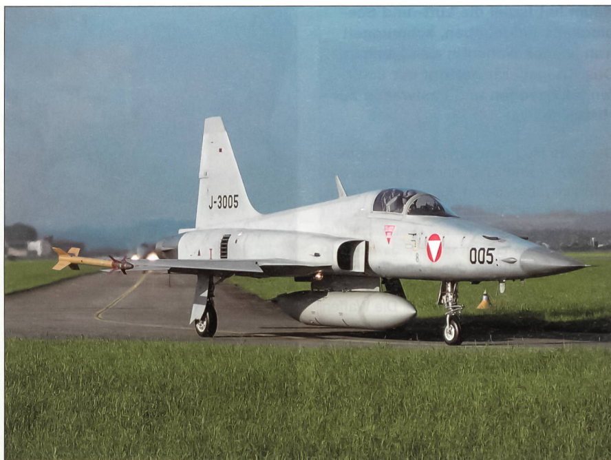
Mit den gemieteten Schweizer F-5 ist die österreichische Luftwaffe zufrieden.

Im Moment behilft sich die österreichische Luftwaffe mit zwölf F-5-Abfangjägern, die sie von der Schweiz geleast hat. Wie Generalstabschef Roland Ertl im Januar 2006 in einem Gespräch mit dem SCHWEIZER SOLDAT ausführte, sind die österreichischen Piloten mit den Schweizer Flugzeugen zufrieden: «Die F-5 bilden bei uns eine aktive Komponente der Luftraumüberwachung. Sie leisten wertvolle Dienste, bis