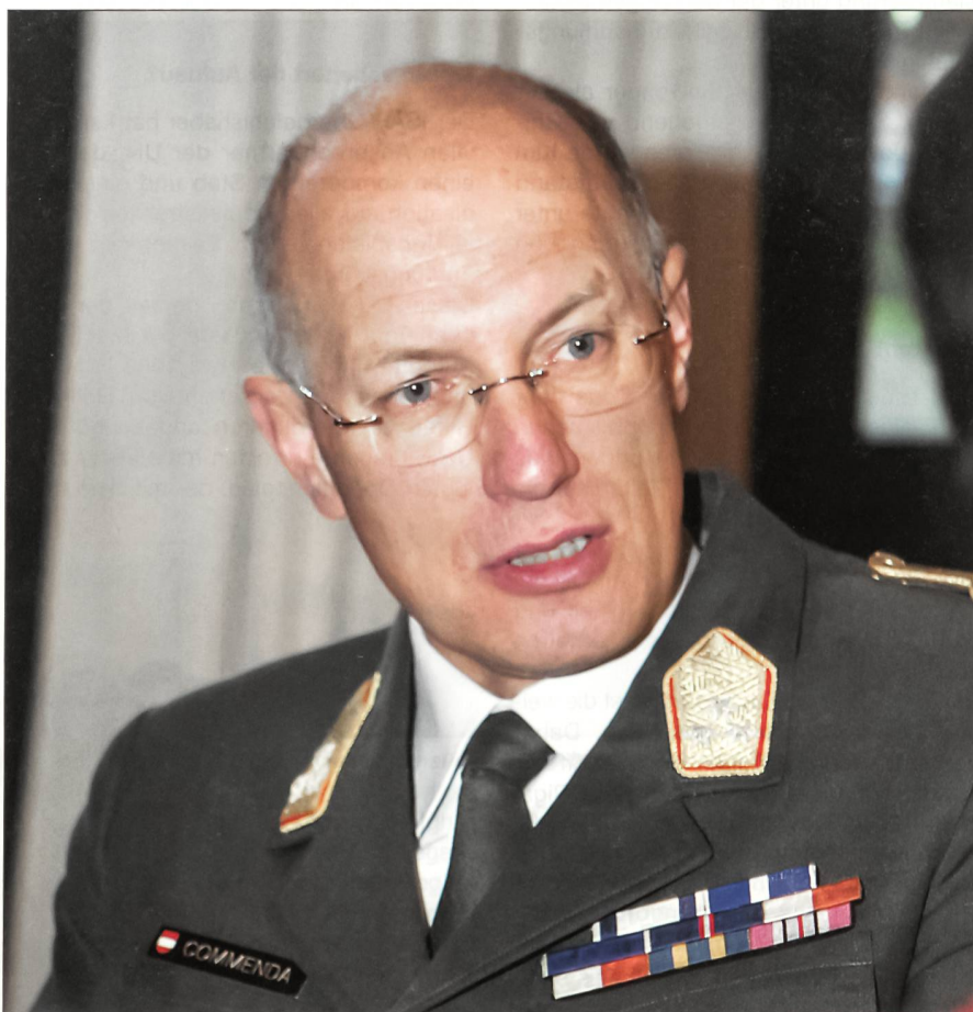
Generalleutnant Othmar Commenda: «Unser Projekt ist im Parlament breit abgestützt.»

Erreichen das Bundesheer und die Reformer um Commenda ihr Ziel bis im Jahr 2010? Commenda schaut über 2010 hinaus: «Wir erkannten früh, dass wir in Phasen vorgehen müssen. Wir arbeiten nach einem genauen Phasenplan. Das Jahr 2010 bildet in diesem Plan nur ein Zwi-