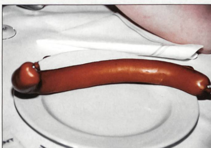
Der legendäre Schüblig.