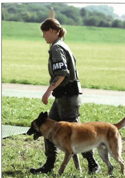
Mensch und Tier.