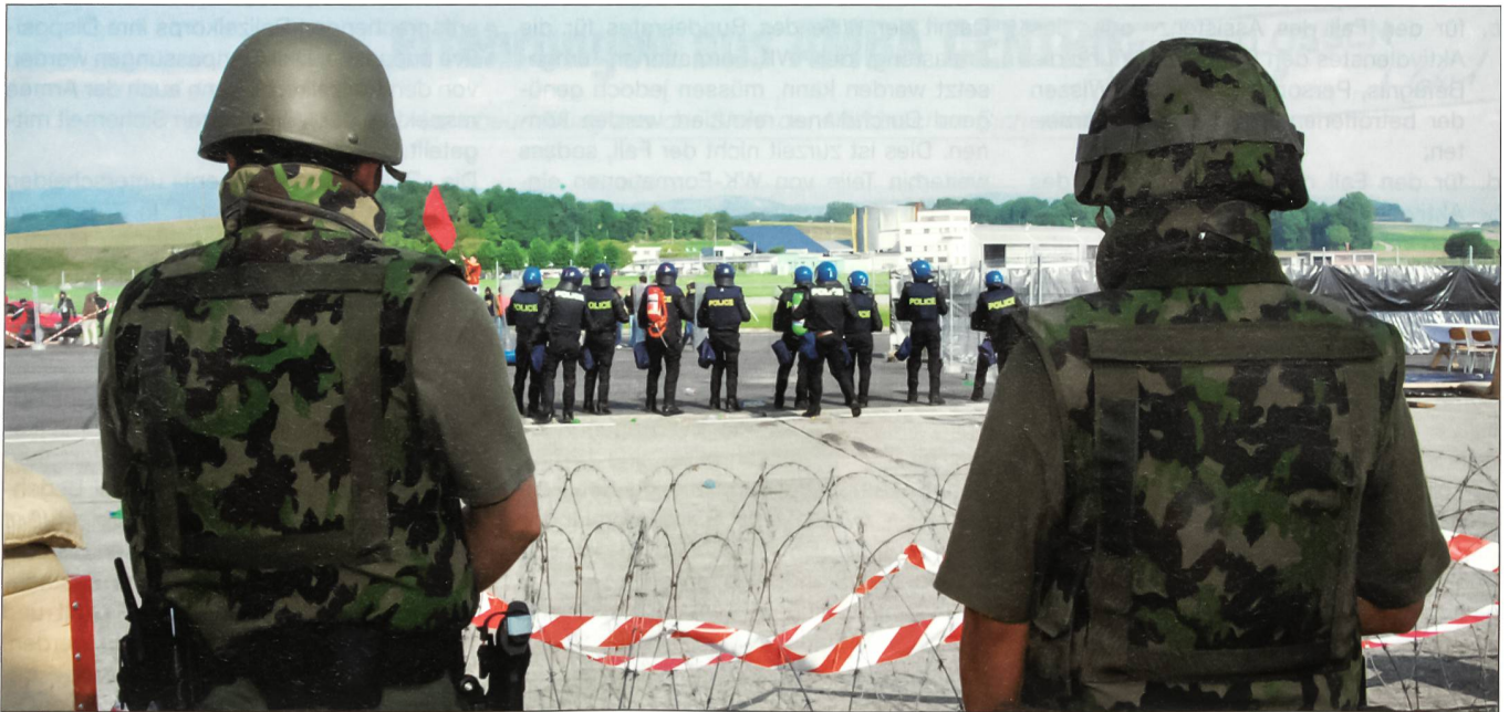
Die Aufträge an die Militärische Sicherheit verlangen Fingerspitzengefühl.

ten Armeeangehörigen Aufträge erhalten, die ihren Fähigkeiten und ihrer Ausbildung Rechnung tragen.