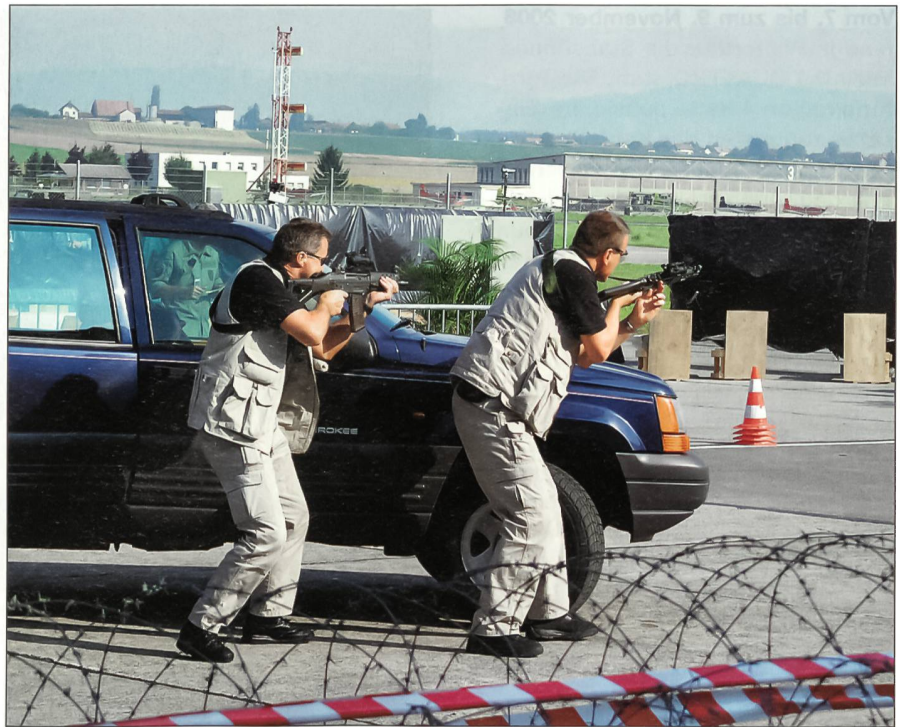
Bewaffnete Militärische Sicherheit.

Die Sicherheitsmassnahmen für die ausländischen Vertretungen in der Schweiz werden vom Kommissariat «Sicherheit Magistraten und ausländische Vertretungen» (SMAV) aufgrund der aktuellen Gefähr-