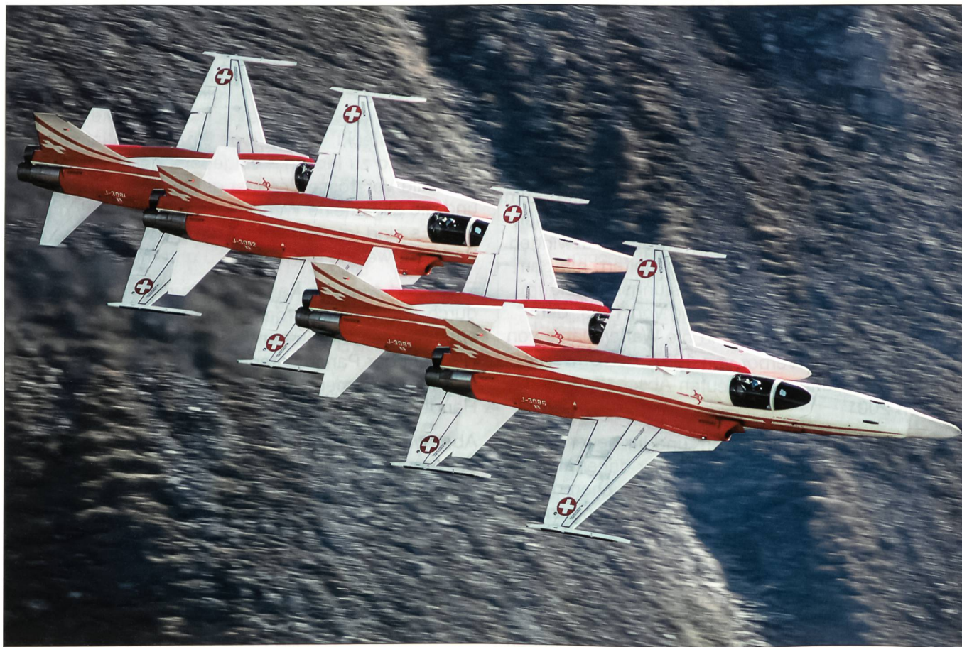
Höchstes fliegerisches Können: die Patrouille Suisse in der Formation Shadow.