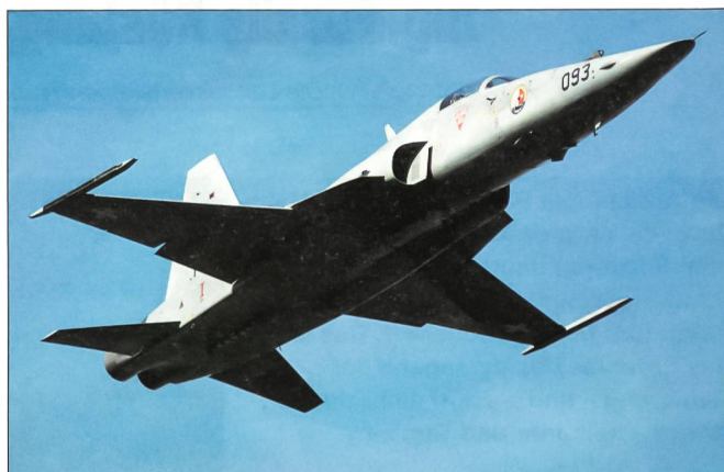
Tiger F-5 der Fliegerstaffel 8 beim Kanonenschiessen.