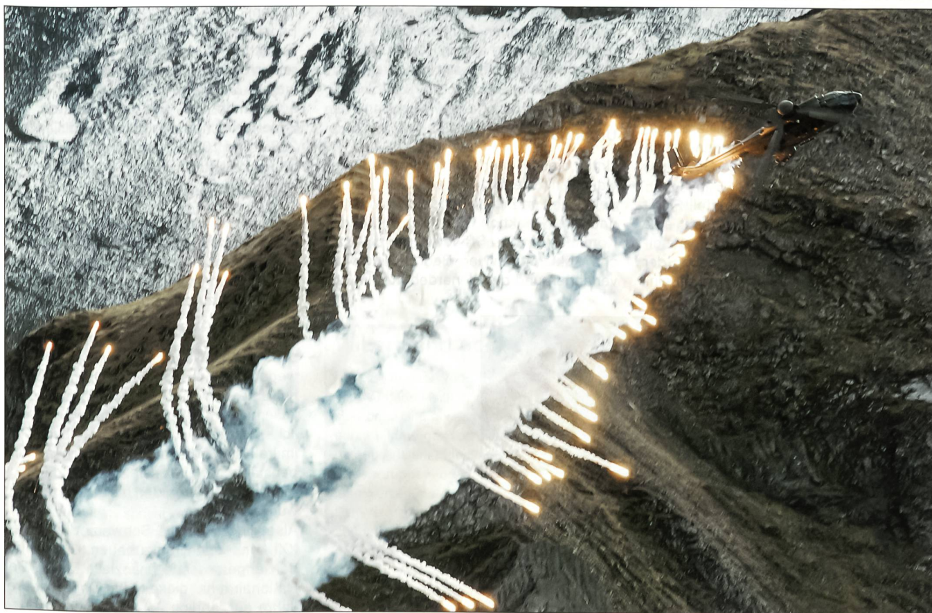
Die 128 Flares, welche aus dem Issys-Selbstschutzsystem des Cougar-Helikopters ausgestossen wurden, sorgten für einen schönen Lichtzauber.