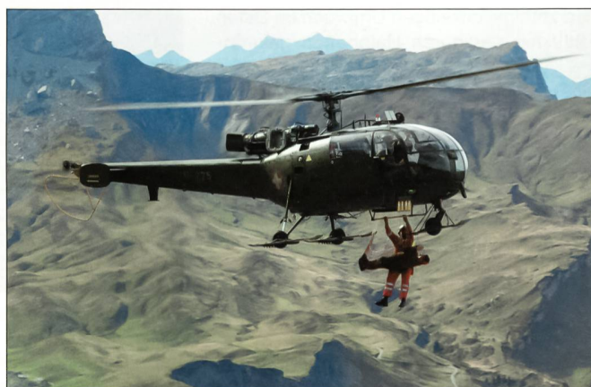
Gebirgsrettung mit Alouette III.