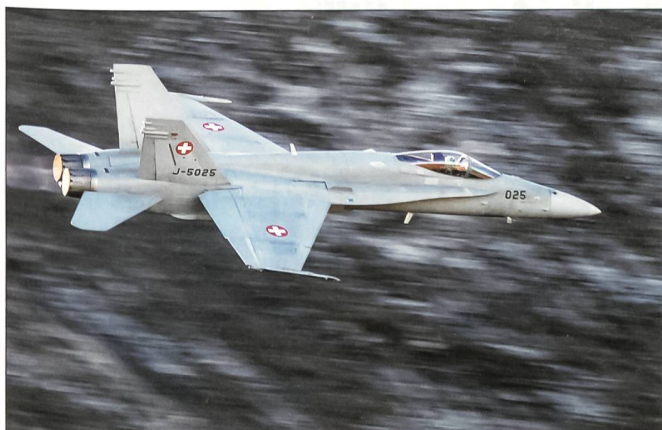
Eindrückliche Demonstration des F/A-18 durch Display-Pilot Hptm Michael Reiner.