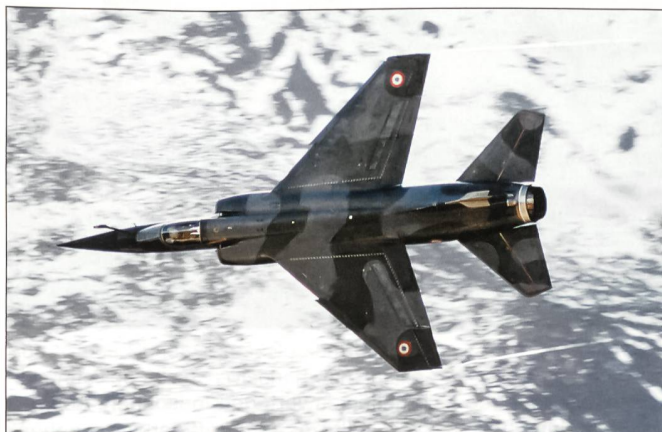
Eine besondere Attraktion waren die französischen Mirage F-1.