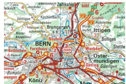
Strassenkarte 1:200 000.

Das Bundesamt für Landestopographie, Swisstopo, publiziert die aktualisierte Strassenkarte. Die Ausgabe 2008-2009 bleibt seinen zwei Formaten treu: eine Karte, Vor- und Rückseite bedruckt, oder