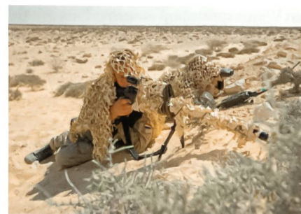
Niederländische Scharfschützen mit AI AWM.

Nach offiziellen Quellen scheint der britische Waffenhersteller «Accuracy International» (AI) mit seinem Modell «Arctic Warfare .338 Super Magnum» (AWM) die Ausschreibung für das sogenannte «next-generation sniper rifle» (Scharfschützengewehr der nächsten Generation) zu seinen Gunsten entscheiden zu können. Das aktuell eingesetzte Modell L96A1 desselben Herstellers im Kaliber 7,62 mm genügt den Ansprüchen der Truppe, insbesondere mit den gemachten Erfahrungen in Afghanistan und dem Irak in den Bereichen Feuerkraft und Reichweite, nicht mehr. Deshalb muss die neue Scharfschützenwaffe über das Kaliber 8,6 mm (.338 Lapua Magnum) verfügen, welches die effektive Einsatzdistanz von bisher 1000 m auf 1500 m er-