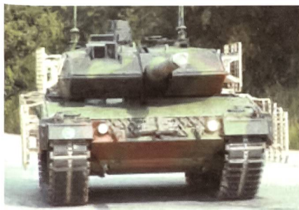
Leopard 2A6M CAN.

Krauss-Maffei-Wegmann übergab den kanadischen Streitkräften den ersten speziell umgerüsteten Kampfpanzer der Version Leopard 2A6M CAN, von welchen 20 Stück für den Einsatz in Afghanistan durch die kanadische Regierung geleast wurden. Beim Leopard 2A6M handelt es sich um die neuste und leistungsfähigste Version des Kampfpanzers, welche unter anderem über einen noch einmal verstärkten Minenschutz sowie