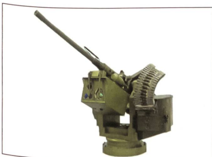
Trackfire RCWS mit schwerem MG.

Saab System hat mit dem neu vorgestellten Trackfire nun auch ein sehr konkurrenzfähiges Produkt im Bereich der fernbedienten Waffenstationen (RCWS). So verfügt das vollstabilisierte System über die Möglichkeit auch im Gelände während der Fahrt zu feuern und Ziele automatisch zu erfassen und gegebenenfalls entsprechend ihrer Bedrohung zu bekämpfen. Daneben kann das