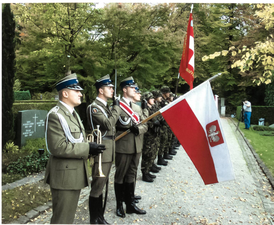
Ehrenbezeugung der polnischen Armee in Winterthur.