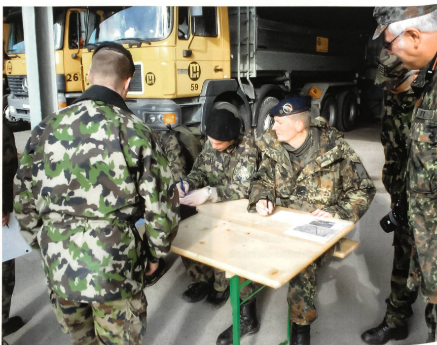
Meldung korrekt erstellen.

Dabei musste durch einen Feuerwehrschlauch und eine Eimerspritze möglichst viel Wasser transportiert werden, was den meisten Patrouillen auch sehr gut gelang.