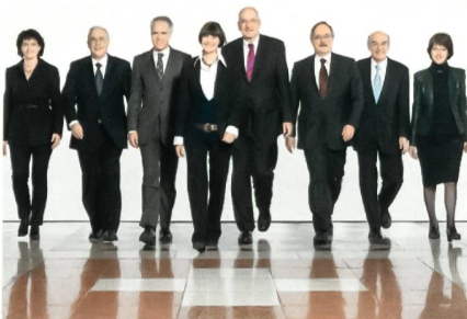
Bundesrat mit Bundeskanzlerin.

Der SiA besteht aus dem Chef des VBS, der Chefin des EDA und dem Vorsteher des EJPD. Der Ausschuss koordiniert departe-