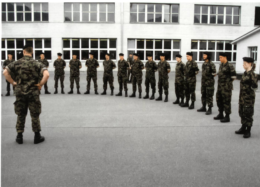
Heute unterstützen (zu) wenige Zeitmilitär-Wachtmeister den Zugführer zum Start der RS – wie hier am 3. Juli dieses Jahres in der Stabskompanie der Panzer RS 21 in Thun. In Zukunft werden die Miliz-Gruppenführer wieder mit von der Partie sein.