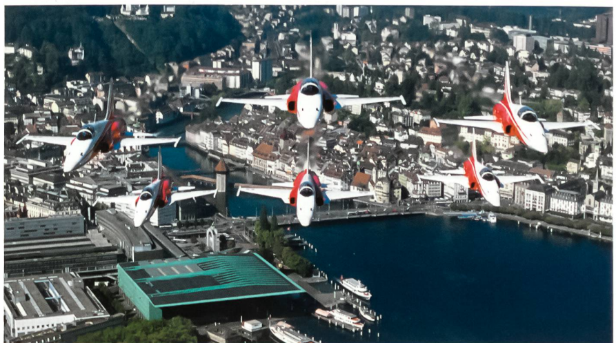
Die Patrouille Suisse im «Doppelpfeil» über dem Luzerner Seebecken.

Der vorliegende Text von Daniel Stämpfli stammt aus dem neuen Buch: Das Überwachungsgeschwader 1992 bis 2005. Die letzten 14 Jahre der traditionellen Berufsformation der Luftwaffe. Herausgegeben von Hanspeter Ruckli, Adrian Urscheler, Matthias Kalt. Das Werk vereinigt spannende Texte und grandiose Bilder. Es kann bezogen werden im Baden-Verlag, 5405 Baden-Dättwil. www.baden-verlag.ch