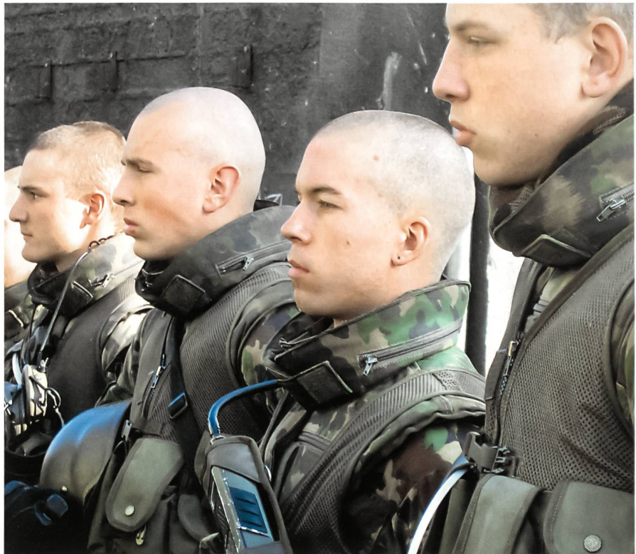
Militärpolizeigrenadiere nach dem Häuserkampf in der Zivilschutzanlage Andelfingen.

Wie Brigadier Staffelbach am 31. Oktober 2007 im Zivilschutzzentrum Andelfingen hervorhob, stellt die Raumsicherung eine recht schwierige Operationsform dar. Die zivilen Instanzen behalten die Einsatzverantwortung; der militärische Kommandant trägt die Führungsverantwortung. In