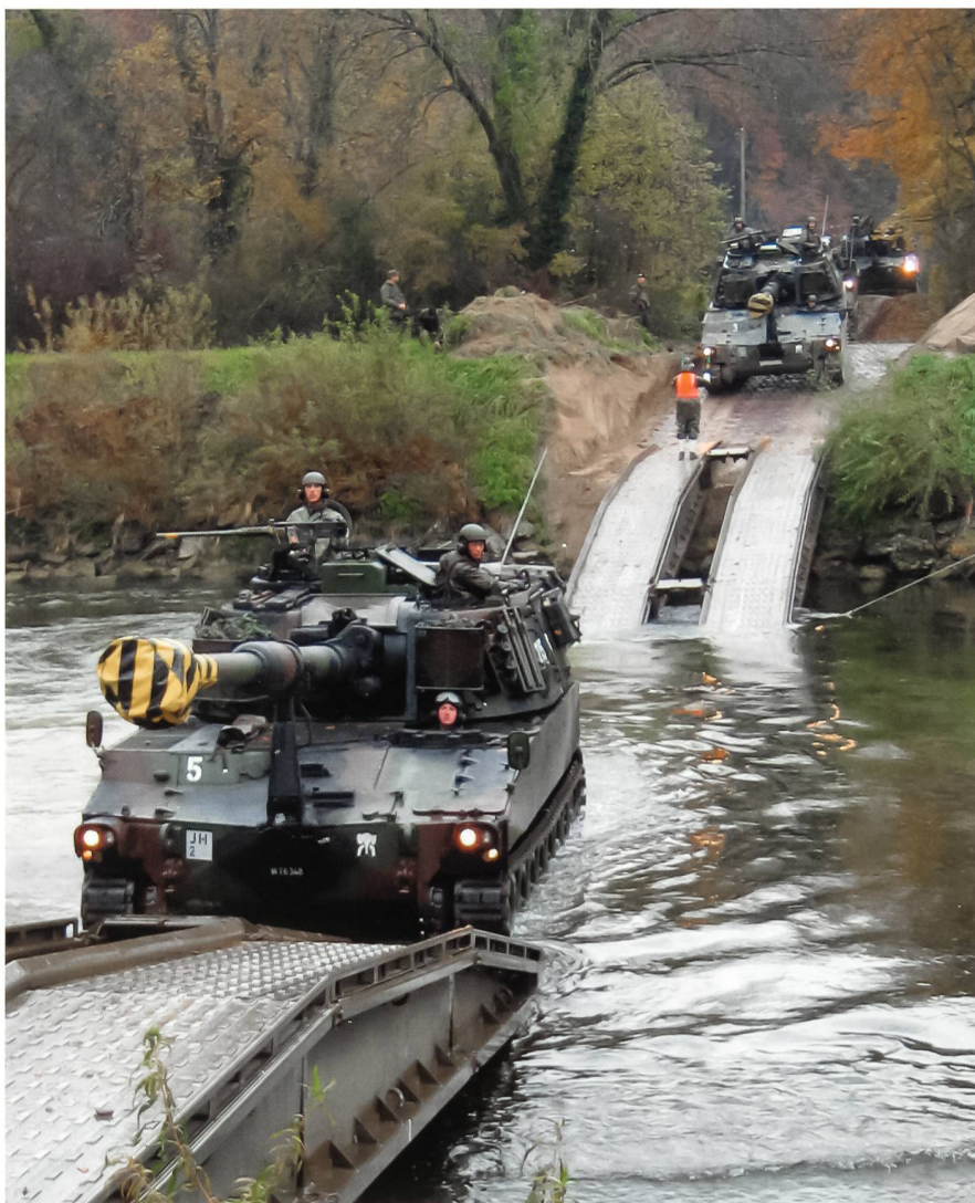
Panzerhaubitzen M-109 der Artillerieabteilung 10 durchqueren die Thur bei Alten über eine Furt, die eine Kompanie des Panzersappeurbataillons 4 erstellt hatte.

«Stellt die Führungsfähigkeit der Brigade im gesamten Einsatzraum sicher.»