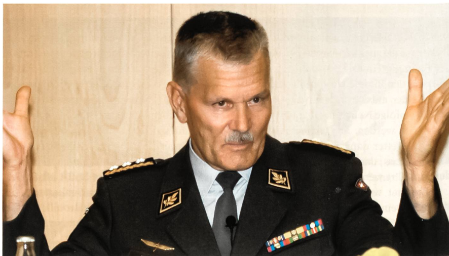
Korpskommandant Christophe Keckeis – kritisch, kühn, klar.

Beim Berufspersonal sei die Armee XXI mit 5300 Stellen geplant worden. Heute seien 4073 Stellen besetzt und weitere 180 bewilligt: «Aber sie sind nicht einfach zu besetzen. Einerseits boomt die Privatwirtschaft, andererseits wurden Abstriche gemacht: am Ansehen, an den Arbeitgeber-