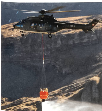
Löschdemonstration mit Super Puma.