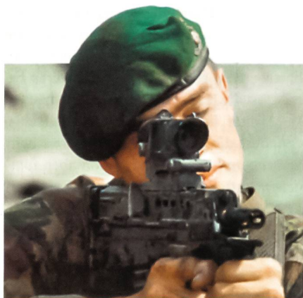
Britisches Sturmgewehr SA80A2.

Die britischen Streitkräfte haben den Bedarf an einer weiteren Überarbeitung ihrer Sturmgewehre vom Typ SA80A2 respektive