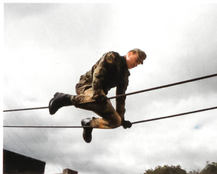
Auf hohem Seil.