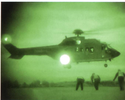
Heli-Landung in der Nacht.