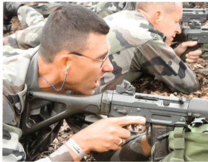
Instruktionstag für Ausländer.

Am Samstag dagegen klarte der Himmel auf, und die 640 Teilnehmer absolvierten die Schlussphase unter recht angenehmen Bedingungen. fo.