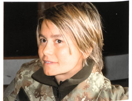
Gut gelaunt trotz Anstrengung.