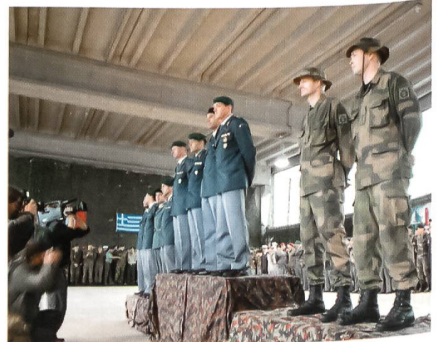
Siegerehrung in Bière.