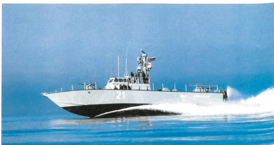
Das Schnellboot Ankaran, ein israelisches Super-Dvora-Produkt, auf der Adria.