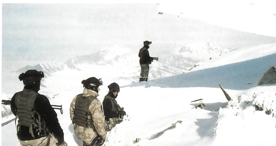
Am 7. Februar 2005 bargen slowenische Soldaten in Afghanistan auf 3071 Metern Höhe die Opfer eines Flugzeugabsturzes (B-737 der Kam Air).