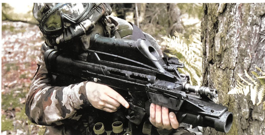
Die Infanterie bildet das Schwerkriegs der slowenischen Streitkräfte.

Die slowenische Marine verfügt über das Schnellboot Ankaran, ein israelisches Schiff der Super-Dvora-Klasse. Es handelt sich dabei um das grösste Wasserfahrzeug der Slowenen. Das Boot ist mit 20-Millimeter-Kanonen und Maschinengewehren ausgerüstet. Die Marine setzt auch Taucher ein. slo.