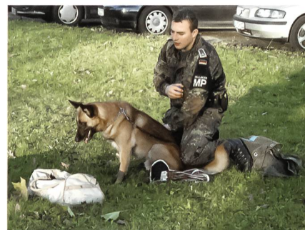
Ein verdächtiges Gepäckstück: Der Diensthund setzt sich hin und gibt so ein Zeichen.

Das Ermitteln ist eine von vielen Aufgaben, welche die Feldjäger der Bundeswehr erfüllen. Fahndungs- und ermittlungsrelevante Erkenntnisse werden mit der örtlichen Kriminalpolizei oder dem Bundeskriminalamt ausgetauscht. Die Ermittler der Militärpolizei durchlaufen eine langjährige Ausbildung und absolvieren regelmässig mehrwöchige Praktika bei den entsprechenden zivilen Stellen. «So bleiben wir kriminaltechnisch auf dem neusten Stand!», erklärt L. Weitaus gefährvoller sind die internationalen Einsätze der Feldjäger beim NATO-geführten Einsatz der ISAF in Afghanistan. Nicht