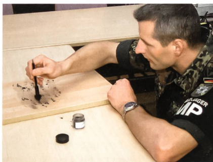
Hauptfeldwebel L. sichert am Tatort Spuren.

«Eine sehr gute Spur!», erklärt der Ermittler. Als Nächstes prüft Hauptfeldwebel L. den aufgebrochenen Schrank. Die Täter hatten leichtes Spiel: Mit einem Schraubenzieher wurde der Schrank aufgebrochen und die Kasse entwendet. Der erfahrene Ermittler macht Fotos vom Tatort. Befragungen vor Ort ergeben keine weiteren verwertbaren Erkenntnisse. Zurück auf seiner