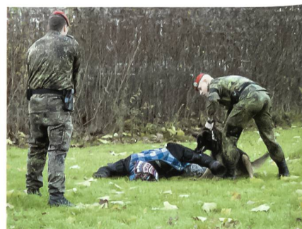
... und wird vom Diensthund gestellt. Ein Feldjäger sichert.

jeder Feldjäger ist von seinem Einsatz gesund nach Hause gekommen (siehe Kasten «Schicksale»).