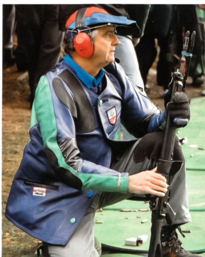
Die Waffe gehört zum Schweizer.

Am 27. September 2007 hiess der Nationalrat mit 100 zu 72 Stimmen eine Motion der ständerätlichen Sicherheitskommission gut, die verlangt, dass die Taschenmunition künftig im Zeughaus gelagert wird.