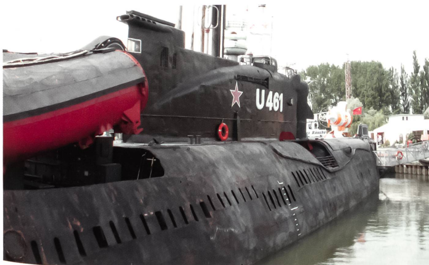
In unmittelbarer Nähe des Museums von Peenemünde kann auch dieses ehemalige sowjetische konventionelle Uboot der Juliett-Klasse besichtigt werden. Seine Hauptbewaffnung waren vier SS-N-3 Shaddock-Marschflugkörper, die zum Einsatz gegen alliierte Überwasser-Kampfschiffe geplant waren.

Eine umfassende Begehung ausserhalb des Museumsgeländes mit Besichtigung von Überresten der Abschussanlagen kann in diesem Nordteil Usedom nur mittels spezieller Führungen gemacht werden.