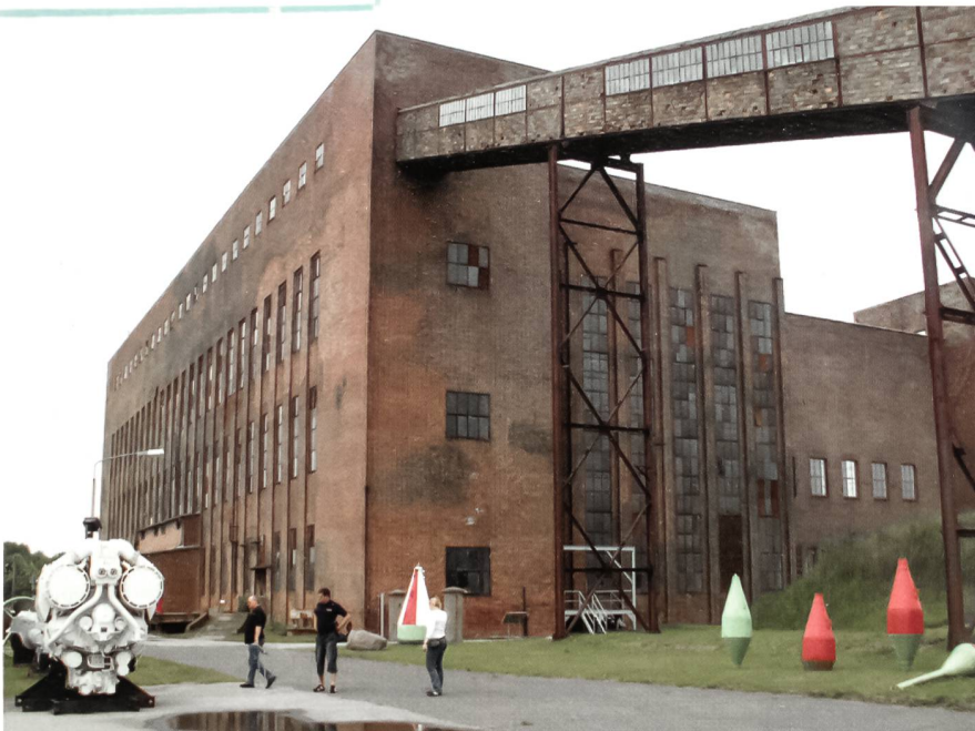
Das Museumsgelände von Peenemünde wird vom massiven Kraftwerkbau dominiert. Hier wurden die riesigen Mengen an elektrischer Energie erzeugt, die zur Forschung, Entwicklung und Produktion der V1 und V2 Raketen erforderlich waren. Heute wird in Ausstellungsräumen auf zwei Etagen über die Aktivitäten der Versuchsstellen informiert.

lagen. Die sowjetischen Marineflieger übernahmen den Flugplatz. 1951 wurde der Hafen Basis für die Seepolizei der DDR und 1956 wurde er Stützpunkt der Marine der Nationalen Volksarmee (NVA) der DDR. 1958 übernahmen die Luftstreitkräfte der NVA den Flugplatz. Bis 1989 war hier das Jagdfliegergeschwader 9, zuletzt mit 42 Maschinen vom Typ MiG-23 der NVA stationiert.