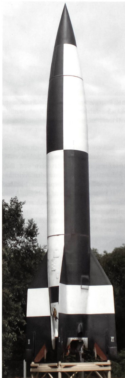
Auf dem freien Gelände des Museums von Peenemünde ist dieses originalgetreue Modell einer V2 Rakete zu sehen. Von dieser ursprünglich als Aggregat 4 bezeichneten Waffe wurden über 5300 Stück gegen den Gegner, vor allem gegen England, abgefeuert.

Zwischen 1942 und 1945 erfolgten auf dem Versuchsgelände von Peenemünde insgesamt 282 Versuchsstarts. Das deutsche