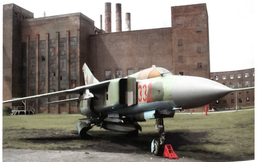
Auf dem freien Ausstellungsgelände des Museums in Peenemünde sind auch zahlreiche Waffen aus der Zeit des Kalten Krieges zu sehen, wie hier eine MiG-23, die ab 1980 zum Jagdfliegergeschwader 9 auf dem nahegelegenen Militärflugplatz der Nationalen Volksarmee (NVA) der DDR gehörte.

Von den Geschehnissen auf dem ehemaligen Grossgelände in Peenemünde liegen heute die noch verbliebenen Bauten des Historisch-Technischen Informationszentrums – eine Art Museum – Zeugnis ab. Die Anlage wurde am 9. Mai 1991 eröffnet, zur Zeit der DDR war dies alles Sperrgebiet gewesen. Zur Anlage gehört im Wesentlichen das Kraftwerk, das unmittelbar am Hafen-