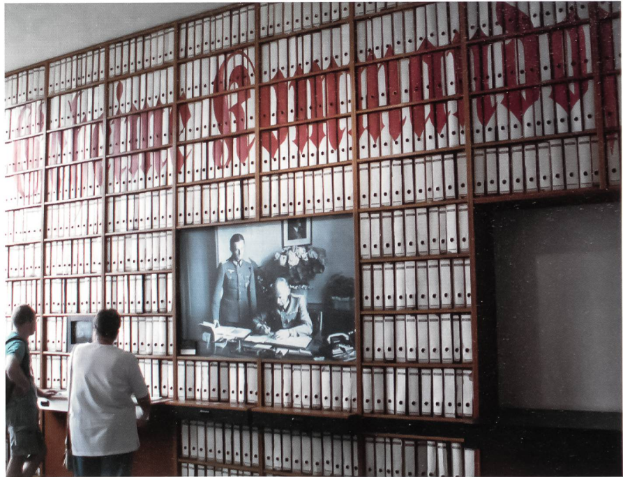
Im Kraftwerkbau des Museums ist auch diese Dokumentationsstelle des für die Entwicklung der V2 verantwortlichen militärischen Chefs, General Walter Dornberger, zu besichtigen. Der Schriftzug «Geheime Kommandosache» ist über der riesigen Front der Ordner zu lesen.

Dies nicht zuletzt deswegen, weil in diesem Gelände durchaus noch Minen lagern könnten.