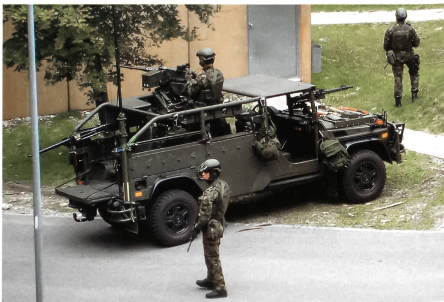
AUF 06: Elitetruppe für Sonderoperationen.

Als Transportmittel steht eine angepasste Version des Superpuma zur Verfügung, welcher über eine Vorrichtung zum Abseilen von vollausgerüsteten Soldaten bei vorbereitenden Aktionen sowie eine Vorrichtung zum «fast roping», dem schnel-