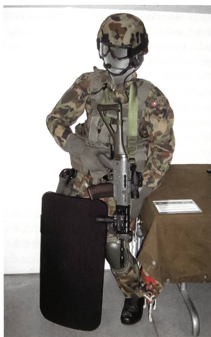
... und zu Lande.