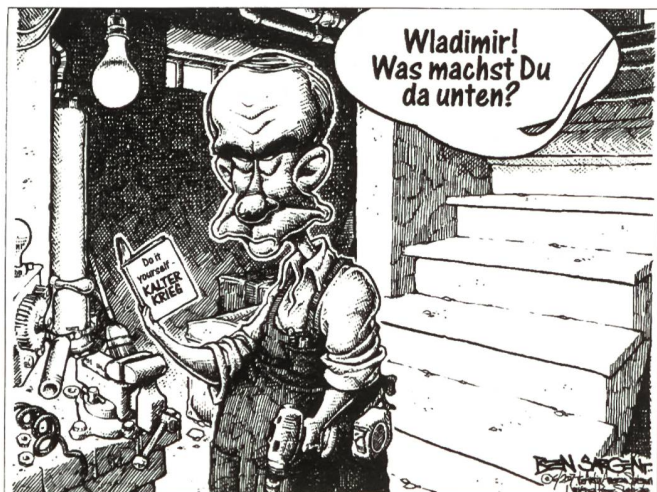
Putin im Keller.