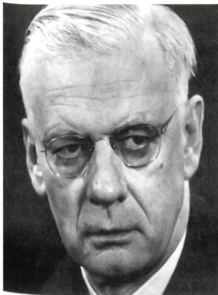
Markus Feldmann, 1897–1958.