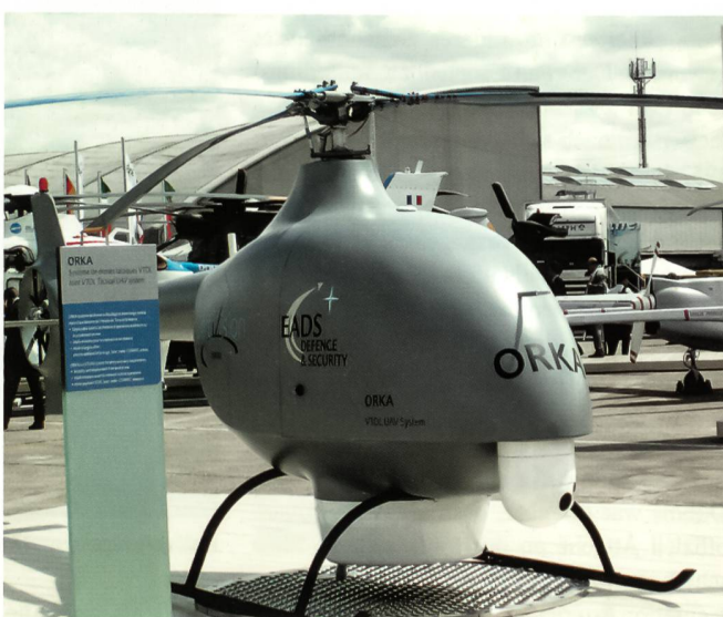
Unbemannte Flugzeuge, sogenannte Drohnen, finden immer breiteren Anklang. Das Bild zeigt das System ORKA, eine taktische Aufklärungsdrohne von EADS.

los der Tiger von Eurocopter und der NH-90 die Publikumsmagnete. Die Schweizer Pilatus Flugzeugwerke von Stans hatten den bewährten PC-6 Porter(Turbo) und die beiden erfolgreichen Maschinen, den Hochleistungstrainer PC-21 und das Geschäftsflugzeug PC-12 ausgestellt.