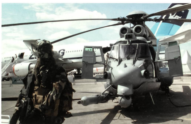
Flugzeuge und Helikopter werden zunehmend für Aufgaben von Spezialkräften eingesetzt (Special Forces). Diese Aufnahme zeigt eine Version des Super Pumas für die französischen Spezialkräfte, seitlich mit Luftbetankungsvorrichtung.