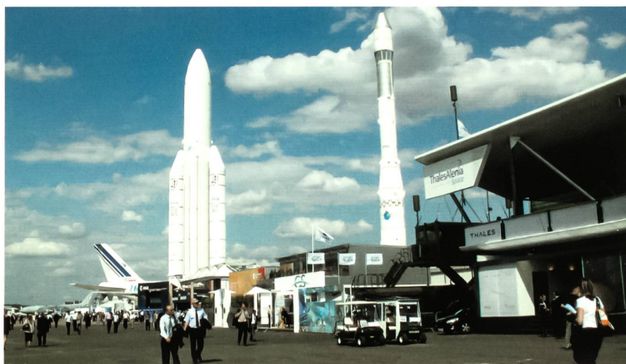
Blick über das Ausstellungsgelände der Paris Air Show von Le Bourget mit einer Ariane-5-Trägerrakete (links).

Die diesjährige Ausstellung von Le Bourget soll als ausgesprochen erfolgreiche Messe in die Geschichte eingehen, denn allein für die Airbus-Hersteller sollen in den ersten drei Tagen Bestellungen für 548 Flugzeuge im Gesamtwert von 75 Milliarden Dollar eingegangen sein, allerdings mehrheitlich für die bereits «betagten» älteren Modelle der Typen A 318, A 319 und A 320. Noch bleibt die Frage im Raum, wie sich dereinst die Lage entwickeln wird, sollten Konkurrenten aus Asien (z.B. China, Indien, Japan) auch auf diesen Markt drängen.