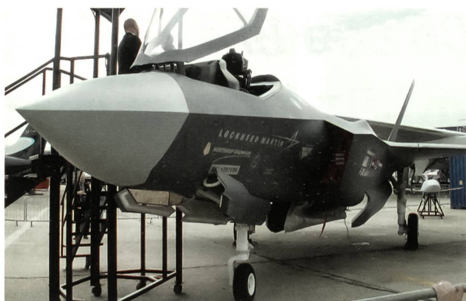
Der Joint Strike Fighter F-35 Lightning II von Lockheed Martin aus den USA gehört zur neuen Generation von Kampfflugzeugen für die US Air Force. In einer Kurzstart-Version (S/VTOL) wird er inskünftig auch von Flugzeugträgern der US Navy aus operieren.