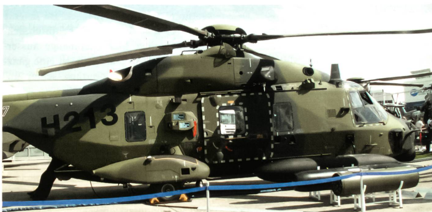
Der neue Transporthelikopter NH 90 in den Farben der deutschen Bundeswehr. Diese Maschine wird dort die betagten CH-53 ersetzen.

Ein Wachstumsmarkt ist zweifellos die Raumfahrt. Arianespace und Astrium bestellten 35 Ariane-5-Raketen. Trägerraketen dieser Art sind in zunehmender Zahl gefragt, nachdem der Bedarf nach Satelliten insbesondere zu Navigations- und Aufklärungszwecken stark steigt.