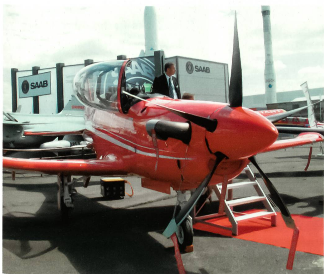
Das hochmoderne Trainingsflugzeug PC-21 der Pilatus Flugzeugwerke in Stans. Die Schweizer Luftwaffe wird diese Maschine beschaffen.