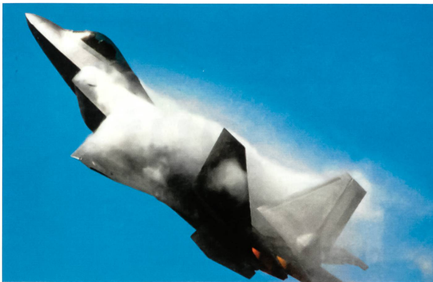
Auf der saudischen Wunschliste: Der F-22 Raptor.

Die saudische Luftwaffe besteht vorrangig aus Tornado- und F-15-Maschinen. Iran verfügt über F-4E-Phantom-, F5-E- und F-14A-Tomcat-Flugzeuge; weiter stehen auf der Liste: Mirage F-1EQ/BQ, MiG-Apparate der Typen 27, 29 und 31 und Suchoi-Maschinen 20, 22 und 25.