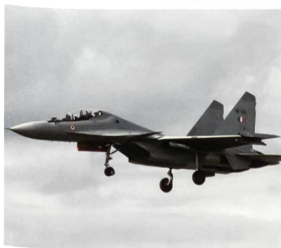
Suchoi-30 der indischen Luftwaffe. Iran will dieses Flugzeug.

In israelischen Nachrichtenbulletins hält sich hartnäckig die Meldung, Iran kaufe von der russischen Firma Rosoboronexport 250 Suchoi-30MKM Flugzeuge und 20 Iljuschin-78MKI-Tanker.