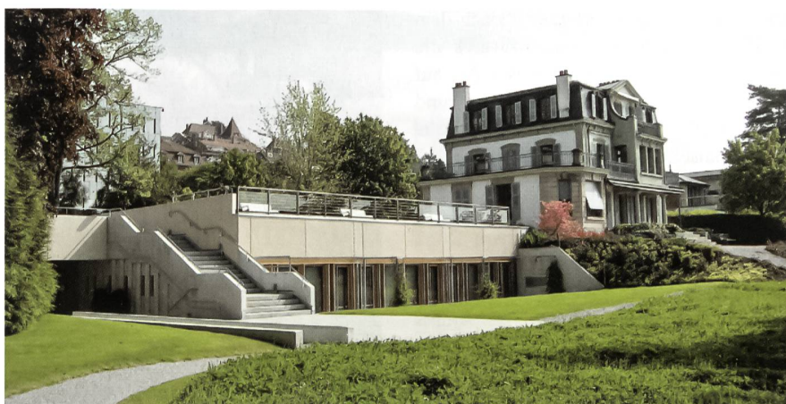
Centre Général Guisan, die ehemalige Residenz von Henri Guisan.

So sollen Kantonaltage Zürich, Wallis und Graubünden durchgeführt werden, und schliesslich plane man für 2008/09 eine Reise