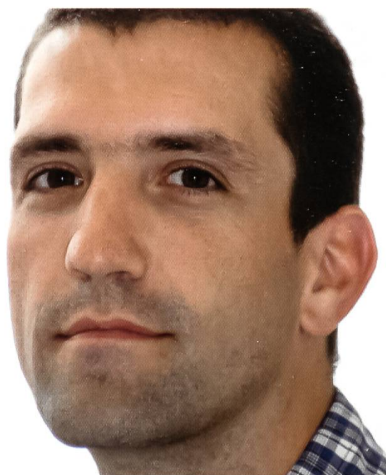
Fahnder Hert: Anders als im Krimi.

Die Polizeifusion ändert an der politischen Kompetenzverteilung nichts. Die Gemeinden sind weiterhin für die Sicherheit verantwortlich, müssen aber die entsprechenden Leistungen künftig bei der Kantonspolizei einkaufen. slg.