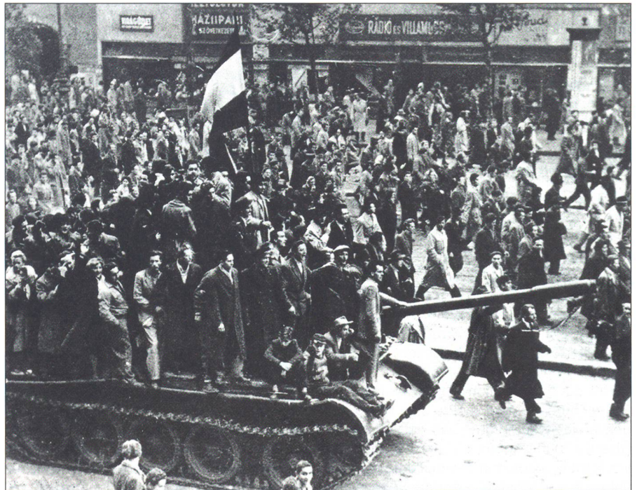
Ungarn erhebt sich – vergeblich.

Umso mehr erstaunt, wie wenig Aufmerksamkeit bei der Beurteilung damaliger Wahrscheinlichkeiten oftmals die Tatsache