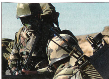
Kampftruppen im Einsatz.