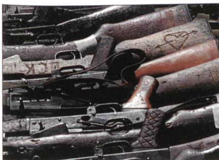
Einsammeln alter Waffen im Kosovo.