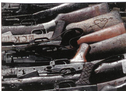
Einsammeln alter Waffen im Kosovo.