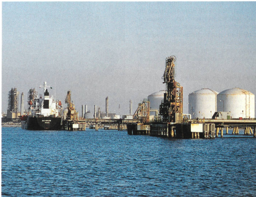
Erdöltransporte sind von grosser Bedeutung.

Mit einem Anteil von rund 57 Prozent am Endenergieverbrauch bilden die Erdölprodukte (Benzin, Heizöl, Dieselöl, Flugpetrol usw.) die Spitze des schweizerischen Energiekonsums. 1973, also unmittelbar vor der ersten Erdölpreiskrise, betrug der Erdölanteil noch ganze 80 Prozent. Seither ist vor allem dank verbesserter Energieeffizienz und eines verbreiterten Energiemixes die Erdölabhängigkeit der Schweiz stark gesunken. In absoluten Zahlen verbraucht die Schweiz heute praktisch gleich viel Tonnen Erdöl wie vor 30 Jahren. Die Tendenz beim Erdölverbrauch ist seit eini-