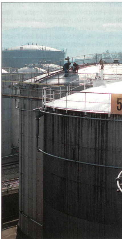
Erdöllager in der Schweiz.

Der Autor ist Oberst i GSt und Geschäftsführer der Schweizer Erdöl-Vereinigung.