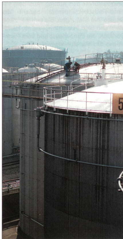
Erdöllager in der Schweiz.

Der Autor ist Oberst i GSt und Geschäftsführer der Schweizer Erdöl-Vereinigung.