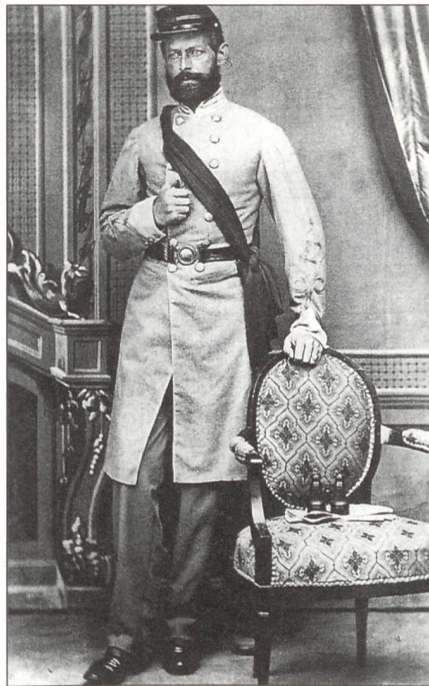
1863/64 reiste Henry Wirz für vier Monate nach Europa. Dabei besuchte er auch die Schweiz. Das 1863 von einem Fotografen in Baden aufgenommene Bild zeigt Wirz in der Uniform der Südstaaten.

Dass Henry Wirz nach dem Bürgerkrieg als einziger «Kriegsverbrecher» am Galgen endete, dafür gibt es verschiedene Gründe. Wirz diente der Justiz in erster Linie als Mittel zum Zweck: Im Fadenkreuz der Jus-