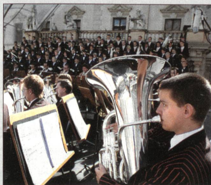
Militärmusik auf hohem Niveau.