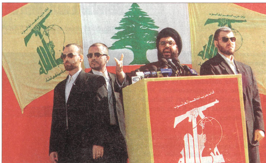
Geschützt von Leibwächtern, ruft Scheich Hassan Nasrallah zum Kampf gegen Israel auf. Er ist der Anführer der Hisbollah. Seine religiöse Ausbildung erhielt der Schiit in der Ghom, der heiligen Stadt.

Hightech-Waffen («Drohnen», Seezielenk-Waffen C-802), die Fähigkeit, auf unkonventionelle Machtquellen zurückzugreifen und ein hoher technischer Entwicklungsstand gehen weit über die bisher in der Welt bekannten Standards terroristischer