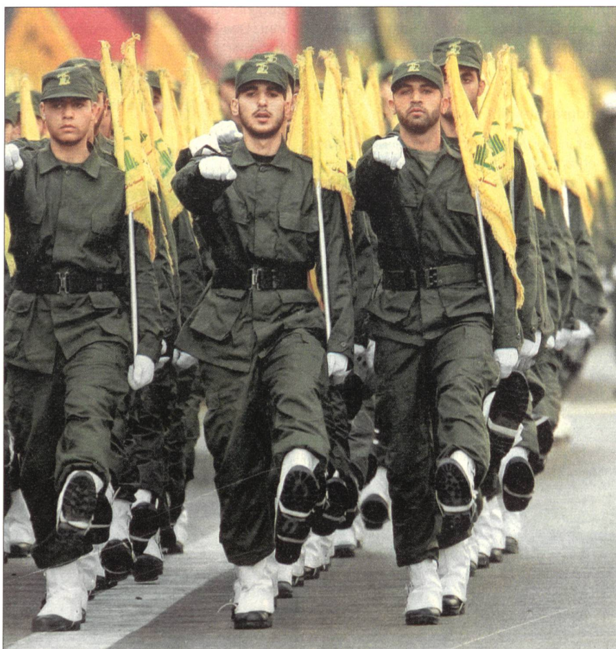
In Paradeuniformen marschieren Milizionäre durch das Schiitenviertel Haert Hreik in Beirut. Ende Oktober 2005, am Jerusalem-Tag bekräftigten sie ihren Anspruch auf die heilige Stadt.

Die Hisbollah (Partei Gottes – Hizb Allah) ist eine schiitische, pro-iranische libanesische Organisation. Ihre Gründung fand 1982, nach dem israelischen Einmarsch in den Südlibanon statt. Irans damaliger Führer, Ayatollah Khomeini, schickte 2000 «Revolutionsgardisten» in den Libanon. Diese gaben als «Geburtshelfer» der neuen Miliz Waffen und trainierten sie. Der Zweck war sowohl die Bekämpfung der israelischen Besatzung im Libanon als auch das Bestreben, einen islamischen Gottesstaat im Libanon zu errichten. Die-